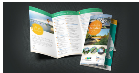
Dépliant de promotion de l'achat local à Portneuf réalisé par le Studio Créatif Valérie Garon