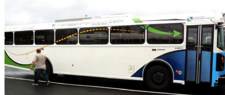
En 2015, le studio a eu comme mandat d'ajouter un peu de vie et de couleurs aux autobus de la Corporation de transport régional de Portneuf.